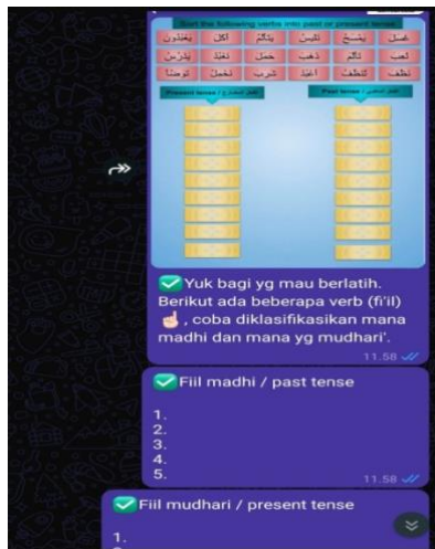
Gambar 1. Kuis Pengayaan

pembelajaran ini justru menitikberatkan pada fungsi semantik aplikatif. Pembelajar tidak lagi dipaksa menghafal tabel tasrīf yang linier, namun langsung diajak berinteraksi dengan esensi makna di balik teks suci Al-Qur'an.